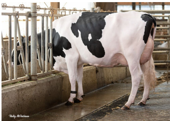
WESTCOAST MAHOMES SKY 12669 DAUGHTER